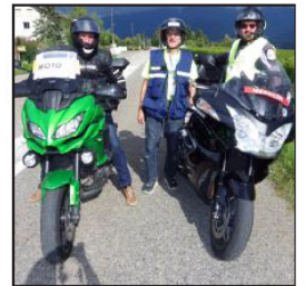
Motards et médecins se tenaient prêts à intervenir au plus vite, si besoin.

Organisée par l'association Saint-Pierre organisation triathlon (Spot) et le club de Chambéry triathlon, la cinquième édition du triathlon de Saint-Pierre-d'Albigny a battu son record de participants. Près de 1 000 compétiteurs avaient répondu à l'invitation des organisateurs pour participer à l'une des huit courses au programme. Après les compétitions par équipe samedi après-midi et dimanche matin, le public venu nombreux tout au long du parcours assistait aux compétitions individuelles dont