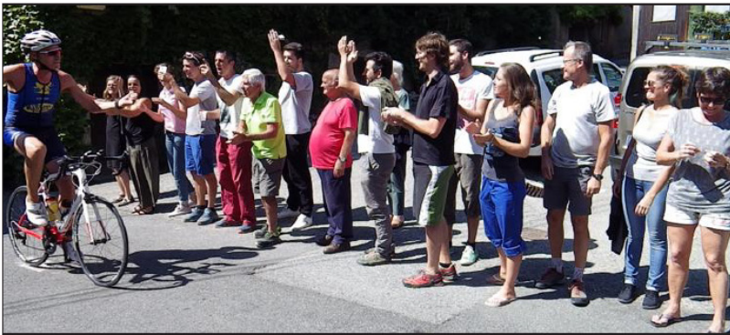
Pluie d'encouragements avant la grimpe vers le château de Miolans.

Organisée par l'association Saint-Pierre organisation triathlon (Spot) et le club de Chambéry triathlon, la cinquième édition du triathlon de Saint-Pierre-d'Albigny a battu son record de participants. Près de 1 000 compétiteurs avaient répondu à l'invitation des organisateurs pour participer à l'une des huit courses au programme. Après les compétitions par équipe samedi après-midi et dimanche matin, le public venu nombreux tout au long du parcours assistait aux compétitions individuelles dont