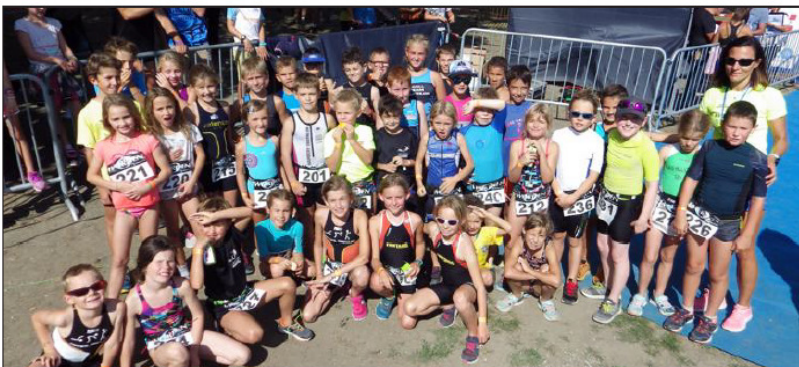
Avec les 6/9 ans.