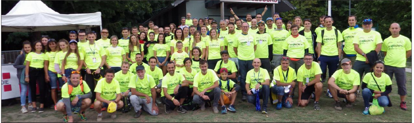
Près de 150 bénévoles ont contribué, pendant deux jours, à la réussite de cette 5 e édition