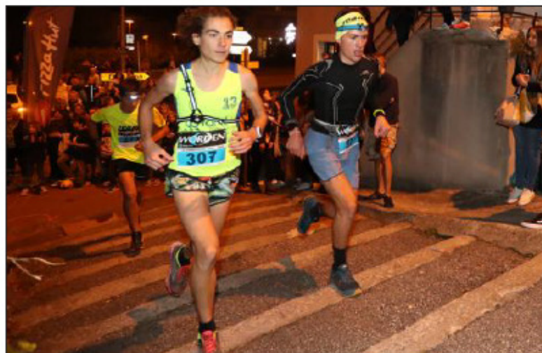
La Chambérienne, c'est l'assurance de se "taper" une fois l'an les escaliers casse-pattes de la fontaine Saint-Martin dès le 2 e km. Le départ (ici du 21 km) et l'arrivée se font dans un effet pyrotechnique.

Retrouvez nos vidéos des départs des 10 et 21 km et du passage de la montée de la fontaine Saint-Martin sur www.ledauphine.com